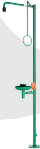
BR 837 085 / 75L