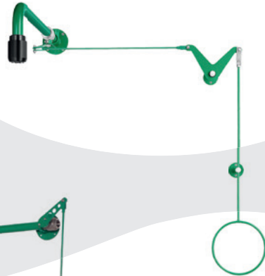
BR 088 085