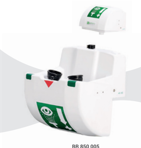
BR 850 005