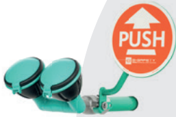
BR 210 085