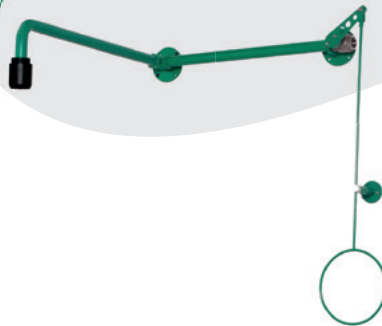
BR 084 085