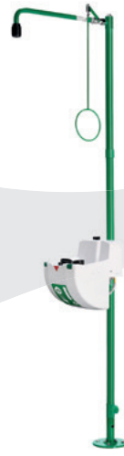
BR 838 085 / 75L