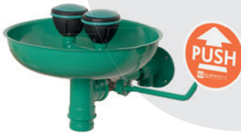
BR 300 085