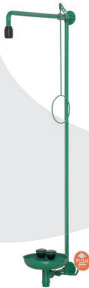
BR 867 085