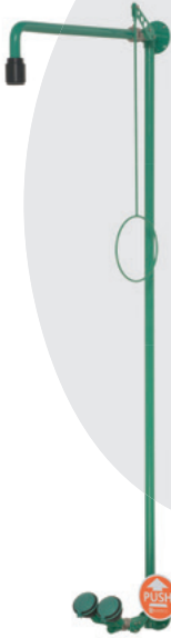
BR 861 085