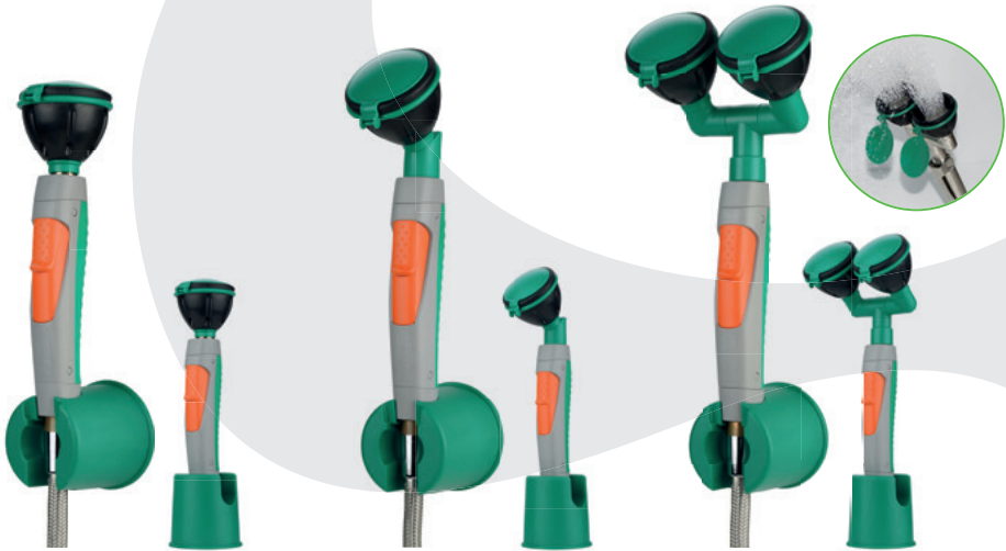
BR 712 025